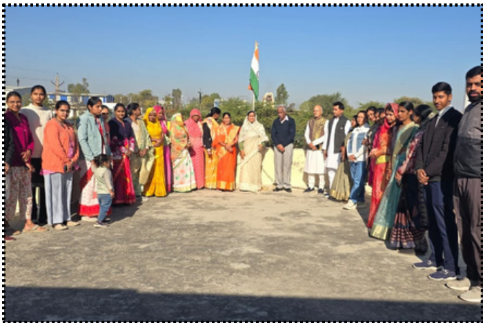
गणतंत्र दिवस समारोह