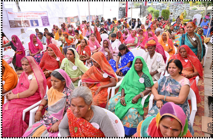
अंतर्राष्ट्रीय महिला दिवस