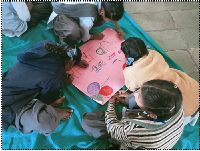
अंतर्राष्ट्रीय बालिका दिवस